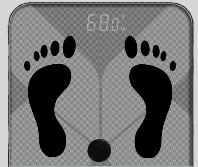
Position auf der Waage